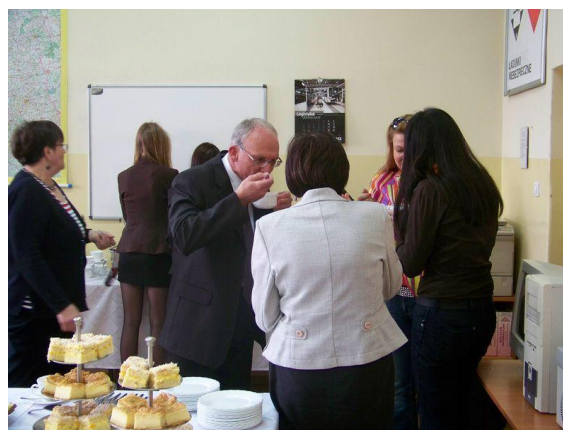
Rozmowy w kularach i poczęstunek