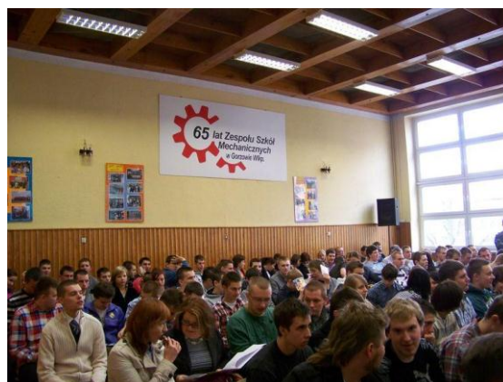
Podczas konferencji aula Szkoły