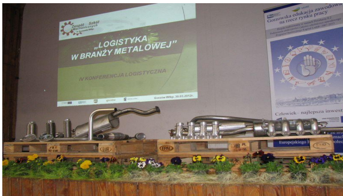
Dekoracja w auli Szkoły