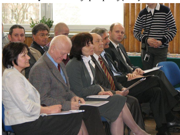
Zaproszeni goście i prelegenci