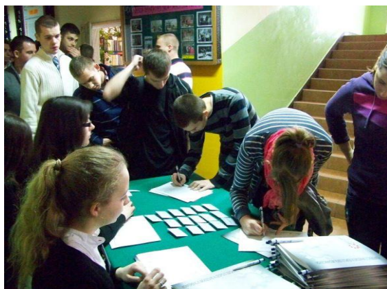
Uczestnicy konferencji podpisują listy obecności